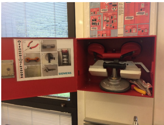
Abb. 1 & 2: Beispiel Sicherung von Hilfsmitteln