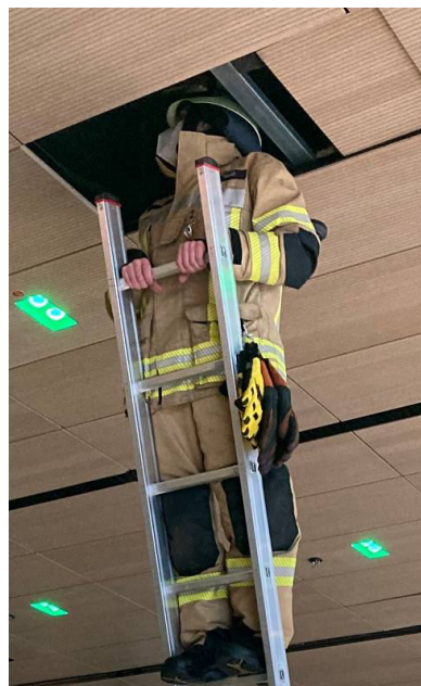
Abb. 4 & 5: Beispiel Kontrolle von Meldern in Zwischendeckenbereichen