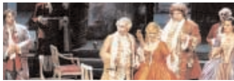
13:45 Opernhaus Düsseldorf, Garderobenfoyer UNTERWEGS IN DIE BOHÈME

Ein Wandelkonzert mit Beiträgen aus der Welt der Oper führt die Zuschauer durch und um das Opernhaus. Ab 14:30 Uhr dürfen die Besucher des Hauses die "Bretter, die die Welt bedeuten" betreten, wenn das OPERNSTUDIO eine gekürzte Fassung von Puccinis berühmter Oper "La Bohème" präsentiert, die der renommierte Regisseur CHRISTOF LOY einstudieren wird.