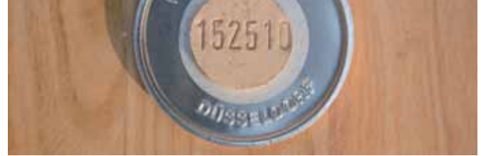
Schamottstein (feuerfester Identifikationsstein)

Das Krematorium Düsseldorf verfügt über drei erdgasbetriebene Etagenöfen mit je drei Brennkammern: Hauptbrennkammer, Ascheausbrennkammer und Rauchgasnachverbrennung. Jeder Sarg kann der Verbrennung nur einzeln zugeführt werden. Die Brennkammern sind mittels Drehplatten voneinander getrennt, ein Vermischen der Asche ist ausgeschlossen. Die Einäscherungszeit beträgt je Brennkammer 75 Minuten. Einäscherungen ohne Sarg sind deshalb nicht möglich. Der Sarg gewährleistet eine würdevolle Feuerbestattung bezüglich des Einfahrens in den Ofen. Andererseits begünstigt er den Einäscherungsvorgang durch den Wärmewert des Holzes.