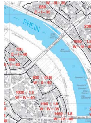
Ausschnitt Bodenrichtwertkarte 2011

Die Ausstellung zeigt neben Preisentwicklungen auch die aktuellen Boden- und Markt richtwertkarten und gibt Erläuterungen, wie diese Richtwerte abgeleitet wurden und angewendet werden können.