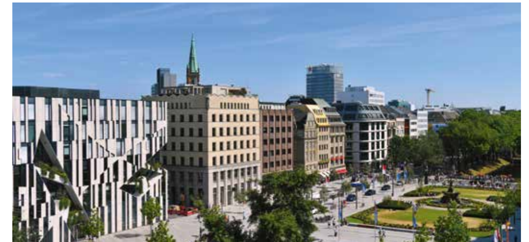
→ Königsallee | eine der exklusivsten Einkaufsmeilen Europas