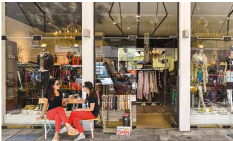
→ Fingern | Shoppen abseits der Kö