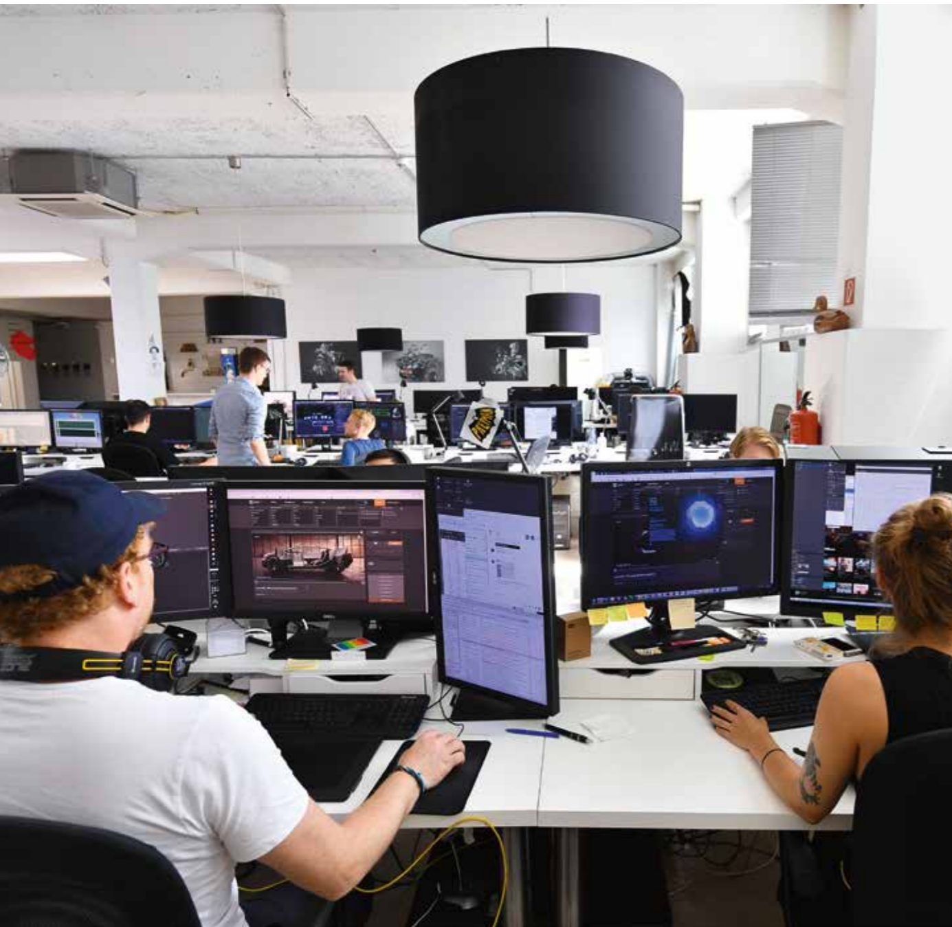
→ Innovationshub | Hochschulen und Unternehmen arbeiten gemeinsam an digitalen Innovationen

Düsseldorfs Stärke ist seine Fähigkeit, Veränderungsprozesse frühzeitig zu erkennen und zu nutzen. Fortschritt und Innovation sind integraler Bestandteil dieser Stadt.