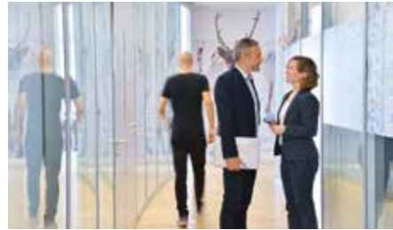
→ GAP 15 | Adresse für Stars und Newcomer

Für Startups oder etablierte Corporates, für Newcomer aus Deutschland oder Investoren aus dem Ausland, für Einzelstarter oder Teampayer, für einen Tag oder ein Jahr oder länger – Düsseldorf hat die perfekte Infrastruktur: 51 Business Center und Coworking Spaces, die rund 85.000 Quadratmeter flexible Flächen bereitstellen. Der Düsseldorfer Markt für Gewerbeimmobilien wartet mit einem umfangreichen und hoch differenzierten Angebot in sämtlichen Teilssegmenten auf.