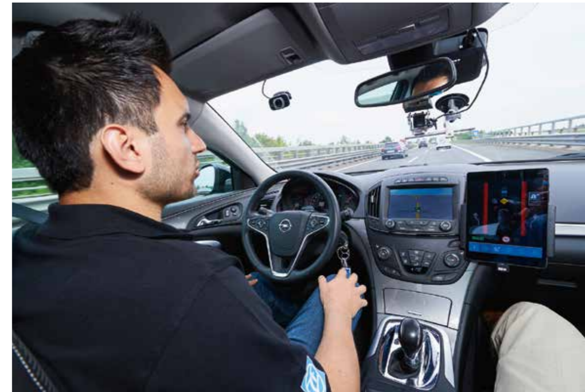
→ Mobilität der Zukunft | Teststrecke für autonomes und vernetztes Fahren

Die Wirtschaftsförderung unterstützt Startups in allen Phasen: vom Test der Idee über die Finanzierung, Standortsuche und Vernetzung mit etablierten Unternehmen bis hin zum Markteintritt in ausländische Märkte. Auf dem Innovationsmanager-Treffen werden Problemlösungen besprochen und beim Mentoring-Programm arbeiten erfahrene Unternehmensvertreter und Startups zusammen.