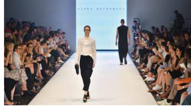
→ Mode | umsatzstärkster Standort in Deutschland