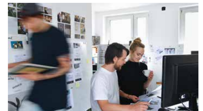
→ Bürogemeinschaften | kreative Arbeitsformen für Startups

Starke Unternehmen brauchen junge Talente mit den unterschiedlichsten Begabungen – und die finden sie hier.