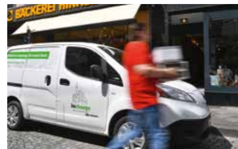
→ Incharge | Startup bietet umweltfreundliche City-Logistik

Düsseldorfs Stärke ist seine Fähigkeit, Veränderungsprozesse frühzeitig zu erkennen und zu nutzen. Fortschritt und Innovation sind integraler Bestandteil dieser Stadt.