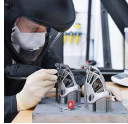
→ Materialforschung | Zukunftsweisende Technologien stammen aus Düsseldorf

Im „Innovationshub für digitale Medienlösungen“ arbeiten Hochschulen und Unternehmen gemeinsam an digitalen Innovationen. Der Innovationshub bietet dafür einen Rahmen für die Ideenfindung, Konzeption, Umsetzung und Verwertung innovativer Lösungen in der Digitalwirtschaft. Hier werden direkt an der Schnittstelle von kreativer und technologischer Entwicklung neue Chancen für die Innovationskraft der einzelnen Partner gefördert. Der Verein „Digitale Stadt Düsseldorf e.V.“ mit seinen rund 300 Mitgliedern lädt regelmäßig zu Netzwerktreffen ein.