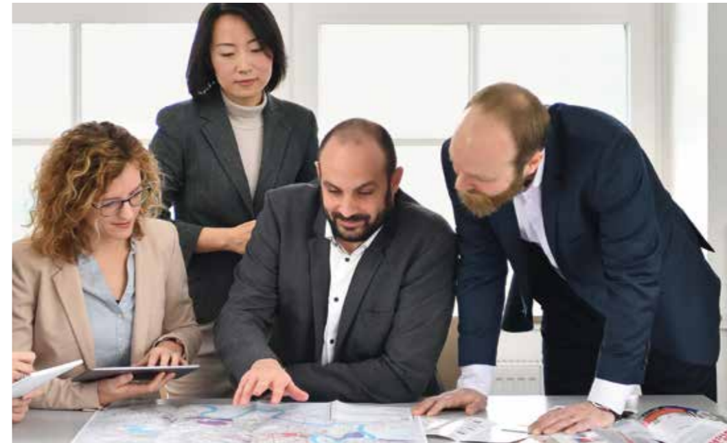
→ Wirtschaftsförderung | Das Team betreut Startups, mittelständische Unternehmen und internationale Corporates.