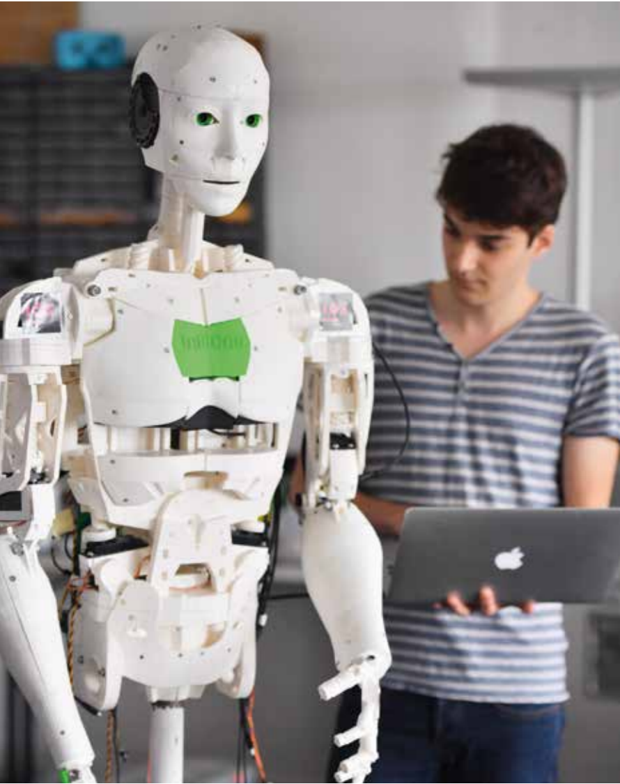
→ IOX LAB | der erste humanoide Roboter komplett aus dem 3-D-Drucker