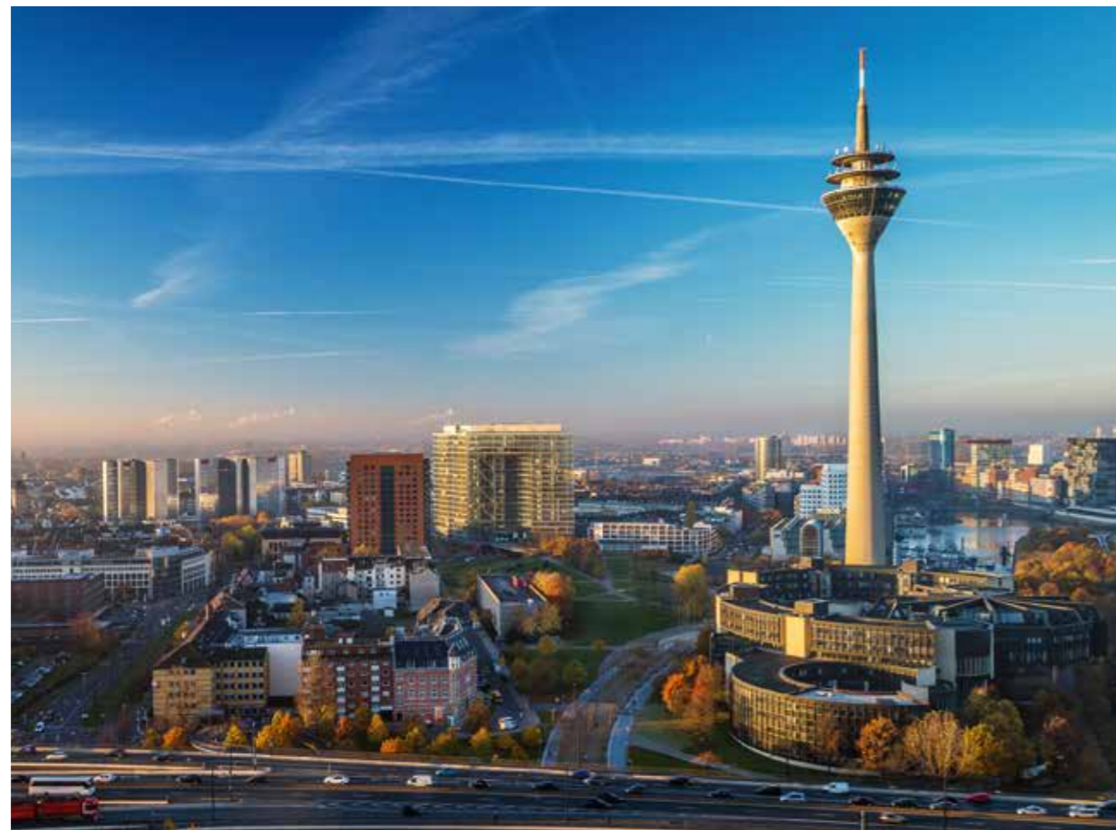
→ Immobilienmarkt Düsseldorf | Angebote für fast jeden Bedarf