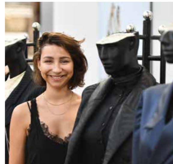
→ Fashion | Düsseldorfer Modeschulen bilden kreativen Nachwuchs aus

Nähe trifft Freiheit, Kreativität trifft Unternehmergeist. In Düsseldorf arbeiten große innovative Unternehmen, die offen sind für Partnerschaften und Kooperationen, zum Beispiel Vodafone, Henkel, Ergo und Ceconomy. Vodafone betreibt in Düsseldorf seinen Vodafone Innovation Park, Vallourec, Voestalpine, Renesas und NEC haben hier ihre Forschungs- und Entwicklungseinheiten. Neben den 3 großen Mobilfunkbetreibern Vodafone, Telekom und Telefónica sind auch die wichtigsten Netzwerkausrüster wie Huawei, ZTE, Nokia und Oracle vertreten. Nicht ohne Grund haben große Unternehmen ihre Digital Units in Düsseldorf angesiedelt, so zum Beispiel Deloitte Digital, SMS digital oder Grohe.