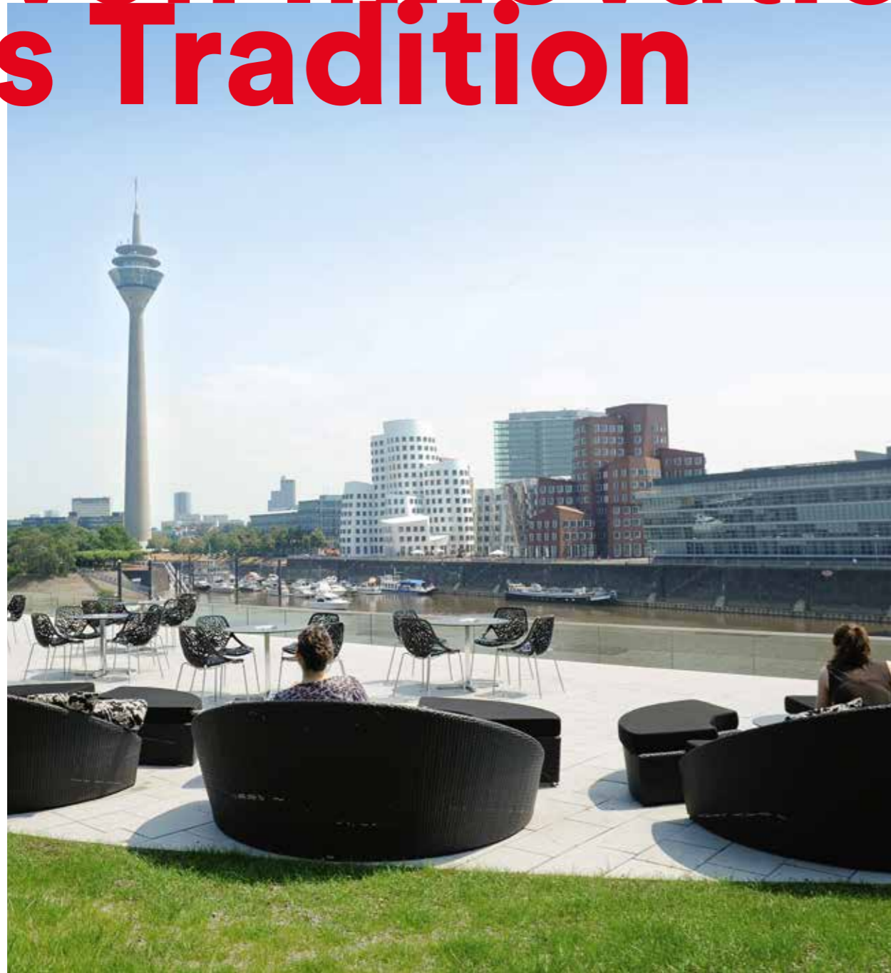
→ MedienHafen | Aus einem alten Handelshafen entstand ein erstklassiger Bürostandort