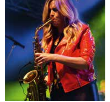
→ Jazz Rally | Top Acts und gute Laune

Düsseldorf – Stadt am Fluss, umgeben von Wäldern, durchzogen von Parkanlagen: Keine andere Stadt in Deutschland bietet