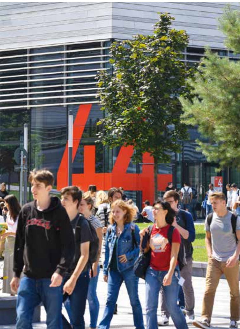
→ Hochschule Düsseldorf – HSD | praxisorientierte Forschung und Lehre

In Düsseldorf gewinnen Unternehmen die Fachkräfte, die sie benötigen, denn die Landeshauptstadt ist bei Talenten in der Region beliebt.