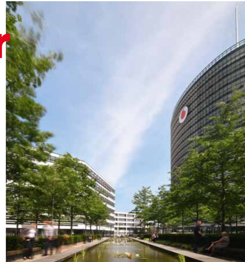
→ Vodafone Campus | Hotspot für Kooperation und Kommunikation