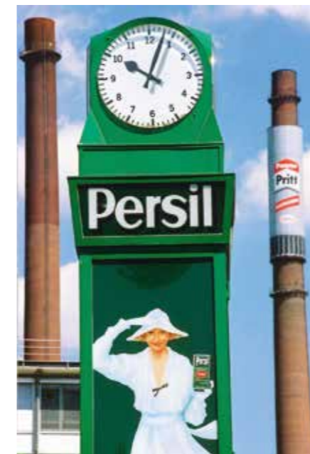
→ Henkel | Düsseldorfer Traditionsunternehmen und Innovationstreiber zugleich

Nähe trifft Freiheit. Düsseldorfer lieben es, sich zu verbinden. Untereinander – und mit der Welt. Die Stadt der kurzen Wege ermöglicht immer wieder zahllose Begegnungen, private und geschäftliche, spontane und dauerhafte. Menschen aus 180 Nationen haben hier ihre Heimat und sind selbstverständlicher Teil von Wirtschaft und Gesellschaft. „Die Welt ist ein Dorf“, wird gesagt – man trifft sich immer wieder. Und dabei ist das Dorf an Düssel und Rhein eine Metropole. Und das mit großstädtischem Flair und einer Weltoffenheit, die ihresgleichen sucht.