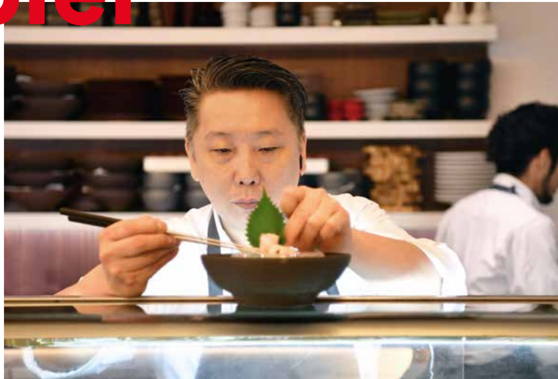
→ Kulinarik | Internationale Meisterköche richten in Düsseldorf an