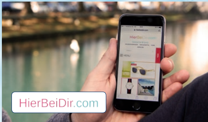
HierBeiDir bietet Düsseldorfer Firmen „schlüsselfertige“ Onlineverkaufsplattformen an.

werden auch kleinere Geschäfte wettbewerbsfähig. Wer keinen eigenen Onlineshop installieren will, kann einen fertigen Onlineshop mieten und braucht nur noch seine Inhalte in das Shop-system einzustellen. Ähnlich arbeitet das Düsseldorfer Start-up HierBeiDir: Es bietet „analogen“ Geschäften an, ihre Waren auf einer nach Orten geclusterten Plattform auch online zu verkaufen.