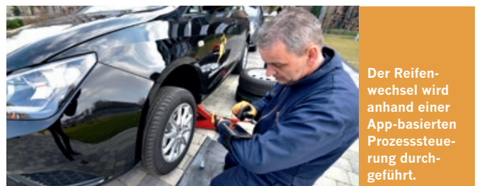
Der Reifenwechsel wird anhand einer App-basierten Prozesssteuerung durchgeführt.

WM Fahrzeugteile bietet Kfz-Ersatzteile namhafter Markenhersteller, Lack und Lackierzubehör sowie Kfz-Zubehör an – und schafft damit 30 neue Arbeitsplätze. Das zeigt, dass Düsseldorf wichtiger Standort für die Logistik- und Großhandelsbranchen ist. In der neuen, 1.000 m 2 Büro- und 4.000 m 2 Lagerfläche umfassenden Niederlassung steht den regionalen PKW- und Nutzfahrzeug-Fachwerkstätten das umfassende Lagersortiment zur Verfügung. Über 50.000 verschiedene Artikel sind ständig verfügbar. Information: Michael Kinn, Tel.: 16097-150, duesseldorf@wm.de