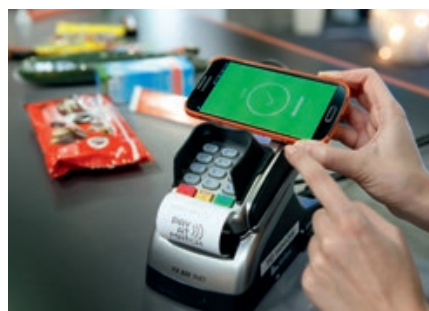
Omnichannel, d. h. Vernetzung aller Kanäle, lautet das Gebot der Stunde im Handel.