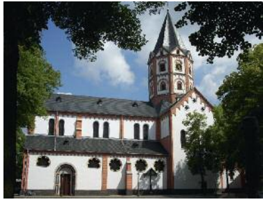
Basilika St. Margareta