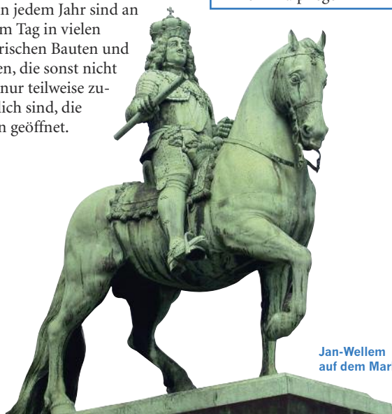
Jan-Wellem auf dem Marktplatz