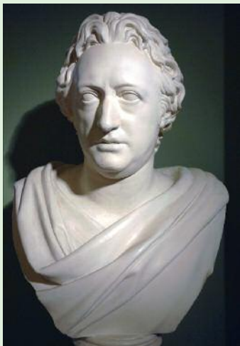
Goethe-Büste im Schloss Jägerhof

Zur zentralen Eröffnungsveran- staltung dürfen wir Sie herzlich begrüßen.