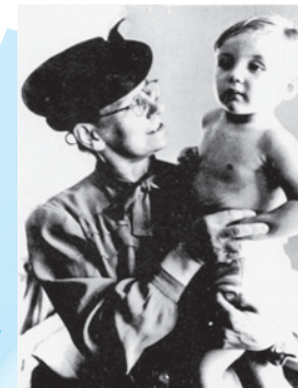
Phoebe Cusden (1887–1981) Ehem. Oberbürger- meisterin von Reading Former Mayor of Reading