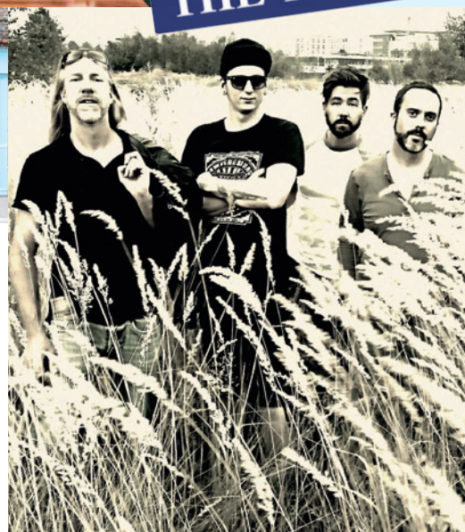
ABERRATIONS / Düsseldorf

ab 19:00 Cocktail / DJ-Night Ort/Place: KIT Café Mannemannufer 1b, Rheinuferpromenade