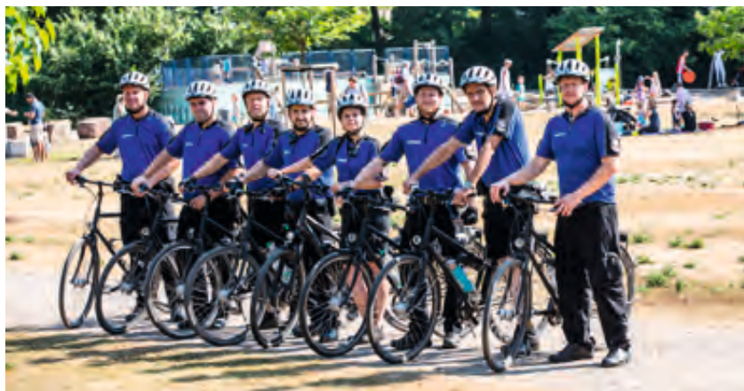
Die Fahrradstaffel des OSD, 2018

Zum 1. Januar 2017 greift nach Zusammenlegung der bisher selbstständigen Abteilungen Verkehrsüberwachung und OSD die neue Organisationsstruktur der Abteilung Außendienste mit nun drei Sachgebieten: Zentrale Dienste, Ordnungs- und Servicedienst, Verkehrsüberwachung.