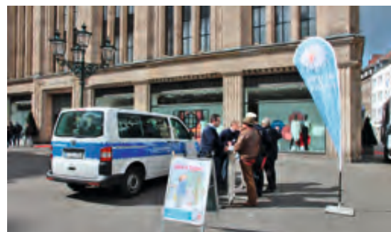
Bürgersprechstunde auf dem Heinrich-Heine-Platz

Der OSD bietet die erste Bürgersprechstunde an. Heute sind es rund 60 pro Jahr.