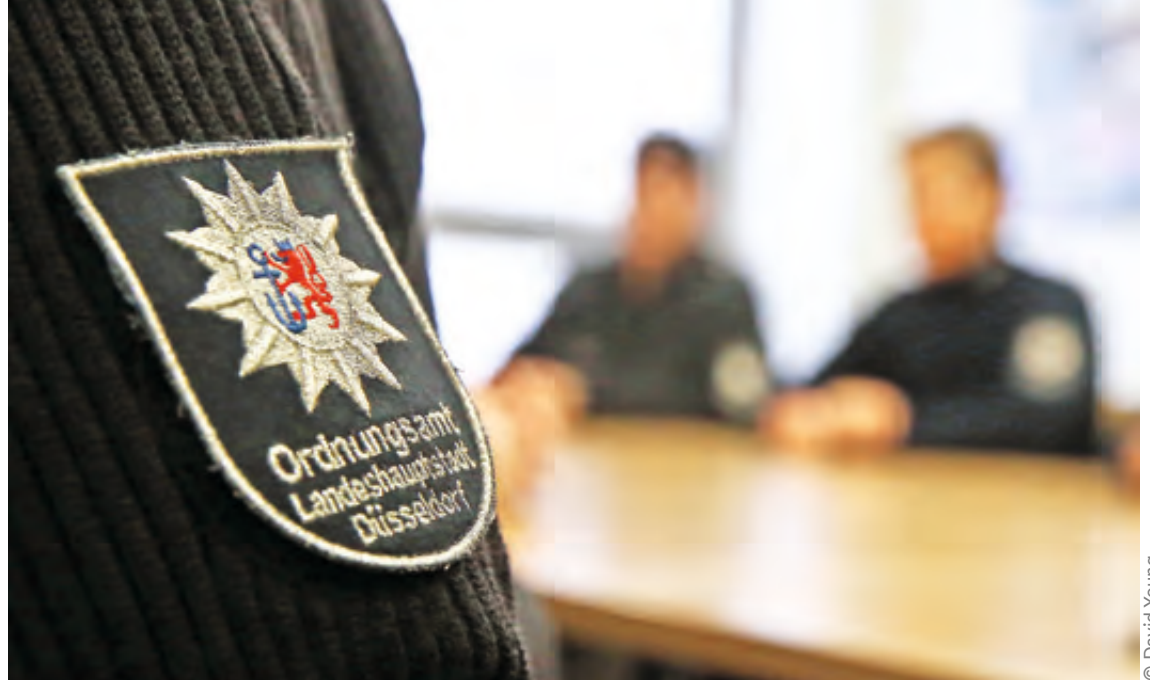
Fach- und Führungskräfte der Abteilung Außendienste schulen die Kolleginnen und Kollegen