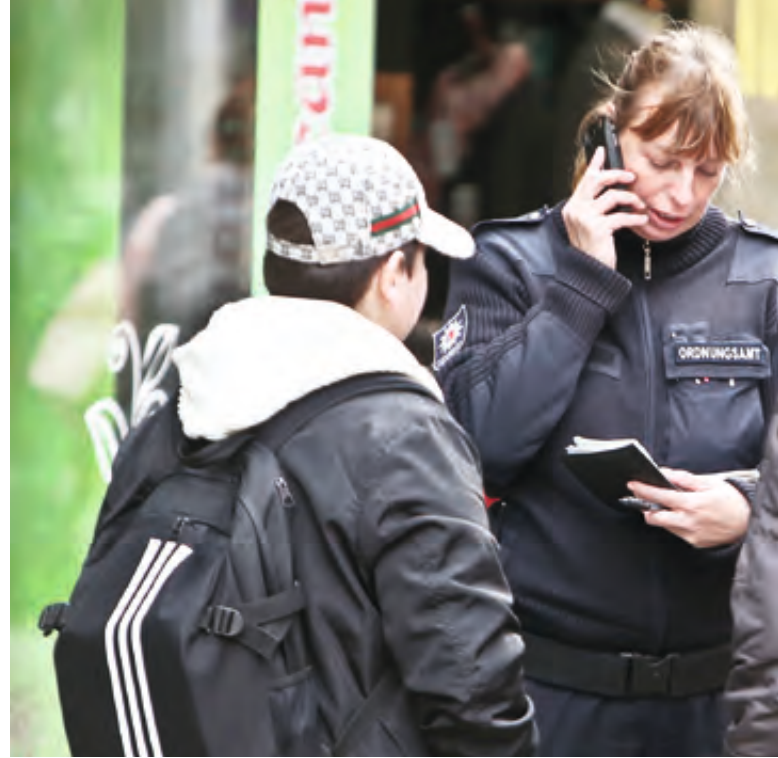
Schnelle Rückmeldung an die Leitstelle per Funk