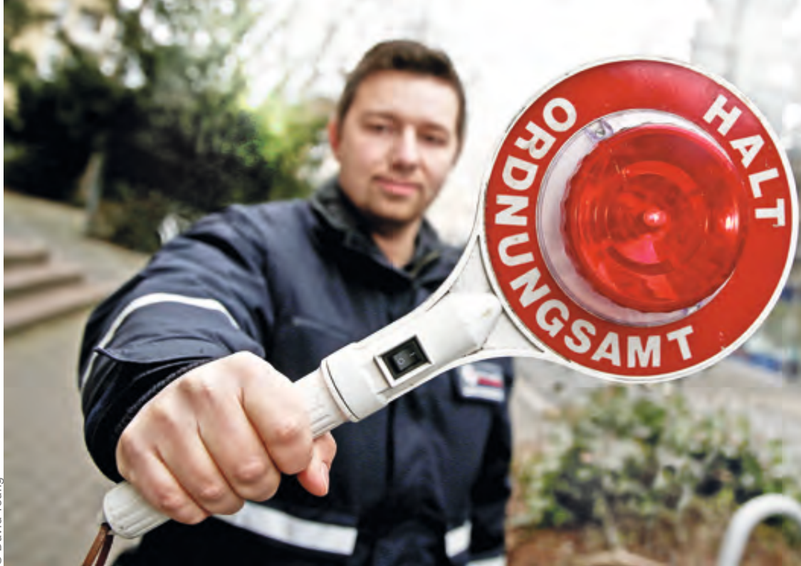
Freundlich aber bestimmt: Absperrungen erhöhen die Sicherheit von Festen