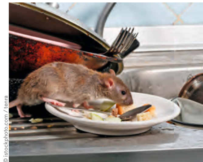
Unhygienische Wohnverhältnisse ziehen Ungeziefer an

Oft bleibt es in letzteren Fällen aber nicht bei den ordnungsbehördlichen Maßnahmen. Schließlich brauchen Menschen, die in ihren eigenen vier Wänden verwahrlosen, Hilfe. Eben diese bietet der OSD, zieht Angehörige hinzu und vermittelt Hilfsangebote in Zusammenarbeit mit einem Facharzt, dem Bezirkssozialdienst oder anderen städtischen Stellen. Darüber hinaus sorgen die Ordnungshüter auch für die Unterbringung psychisch kranker Menschen nach dem Gesetz über Hilfen und Schutzmaßnahmen bei psychischen Krankheiten (Psychisch-Kranken-Gesetz, siehe rechts).