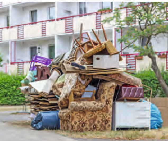
Illegale Sperrmüll- ansammlung