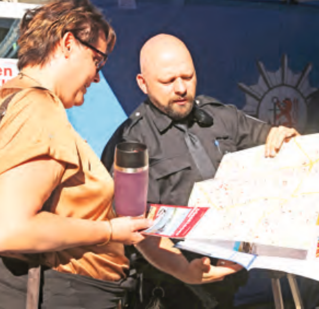
© Benedikt Jerusalem / David Young