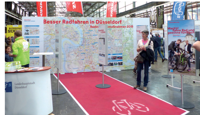
Unter dem Motto Besser Radfahren in Düsseldorf informierte das Amt für Verkehrsmanagement die Besucher über die Radverkehrsmaßnahmen 2019.

Informieren Sie sich beim Amt für Verkehrsmanagement über aktuelle Maßnahmen und Planungen. Sprechen Sie mit städtischen Verkehrsplanern über die Herausforderungen der Radverkehrsplanung und erhalten Sie einen Ausblick auf weitere Planungen.