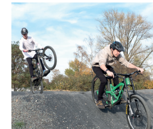
Was ist eigentlich ein Pumptrack und ein Dirtbike-Park?

Für alle Radsportbegeisterten gibt es neben Vereinsinformationen außerdem eine sportliche Herausforderung. Düsseldorf sucht den schnellsten „Carrera-Radrennfahrer“ – Stellen Sie sich der Herausforderung und treten Sie in die Pedale!