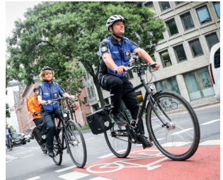
Die Fahrradstaffel soll Falschparkern – vor allem an und auf Radwegen – schnell und flexibel begegnen.

Gerade für die Kinder ist es wichtig zu lernen wie man sich sicher im Straßenverkehr bewegt. Das Lookie Fahrrad-Quiz bietet dem Fahrradnachwuchs die Möglichkeit Wissen über das verkehrstaugliche Fahrrad unter Beweis zu stellen, oder auch etwas zu lernen.