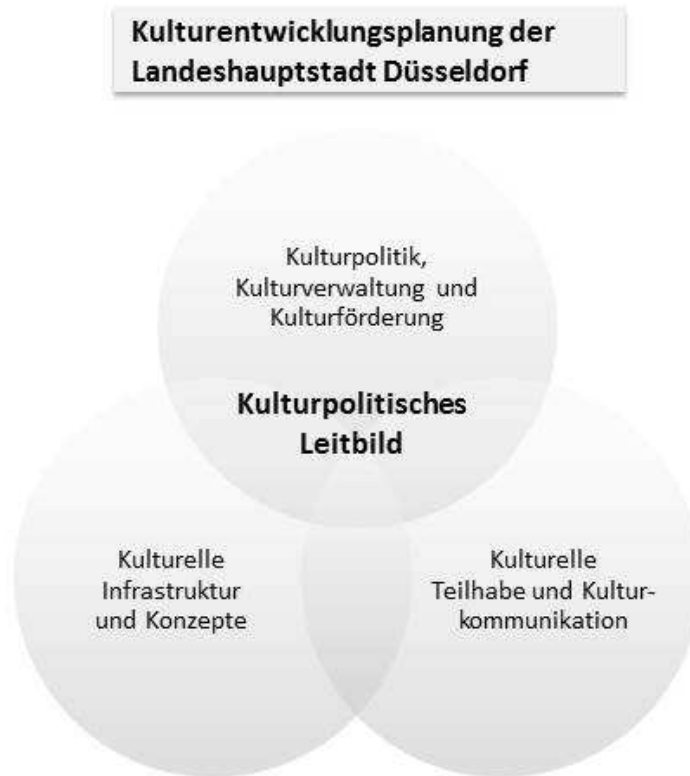
Abb.: Handlungsfelder für die Kulturentwicklungsplanung der Landeshauptstadt Düsseldorf.

Die drei Handlungsfelder samt ihrer Ziele und Maßnahmen werden in den folgenden Kapiteln vorgestellt. Daran anschließend werden diejenigen Maßnahmen präsentiert, die sich als prioritär erweisen und als solche den Beginn der Umsetzungsphase markieren. Im Anhang des Berichts findet sich zudem eine tabellarische Übersicht aller Ziele und Maßnahmen mit Empfehlungen für ihre Priorisierung und einer Auflistung bereits mitwirkender Akteure.