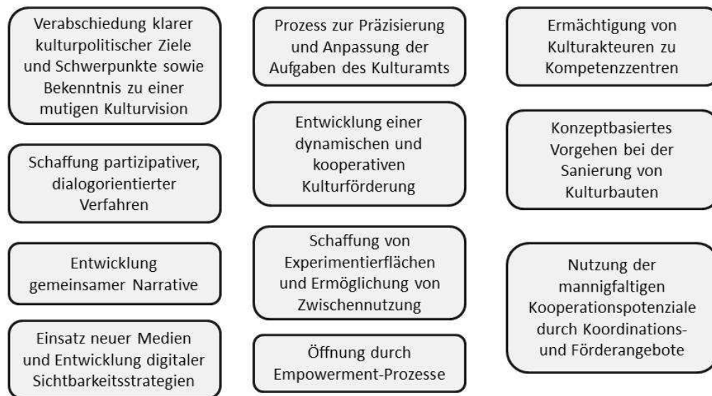
Abb.: Zentrale Herausforderungen für den Düsseldorfer Kulturbereich.