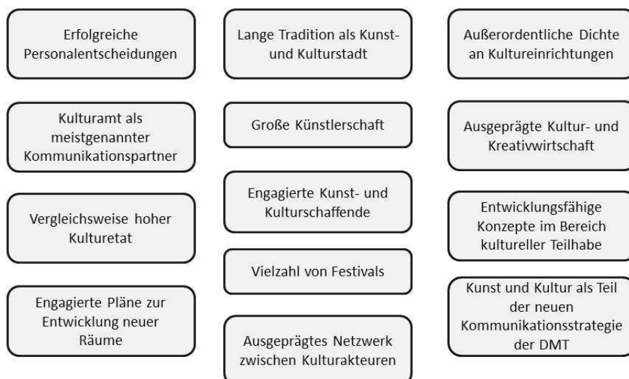
Abb.: Zentrale Stärken des Düsseldorfer Kulturbereichs.