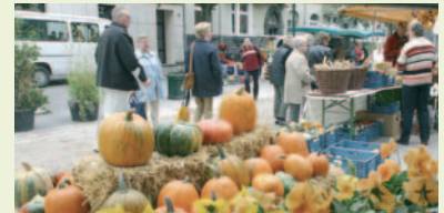
Der Rheinische Bauernmarkt: Ein El Dorado für Liebhaber gesunder Ernährung.

Das Agenda-Projekt „Regionale Vermarktung – Handel der kurzen Wege“ wird vom Umweltamt der Landeshauptstadt und vom Umwelt-Zentrum Düsseldorf e.V. begleitet. Der Erfolg des Rheinischen Bauernmarktes spricht für sich: Die Vorzüge der frischen Produkte aus der Region überzeugen die Kunden ebenso wie die hervorragende Beratung der Direkterzeuger.