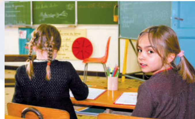
In jeder Klasse sollte wochenweise wechselnd eine Schülerin oder ein Schüler das Lüften übernehmen.