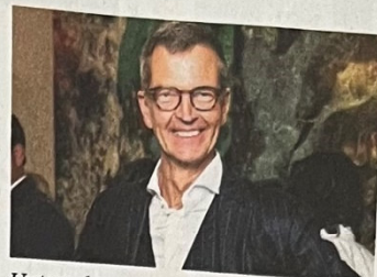
Unternehmer Josef Hinkel (Erster Bürgermeister von Düsseldorf)