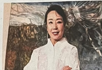
Schriftstellerin Yan Geling, Mitglied der Oscar Academy