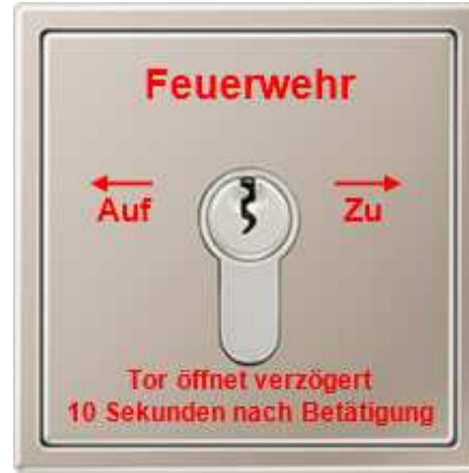
Beispiel Schlüsselschalter mit Beschriftung