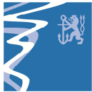
Bild: Beispiel einer Schleusenkenzeichnung – bei Veranstaltungen mit erhöhtem Publikumsaufkommen