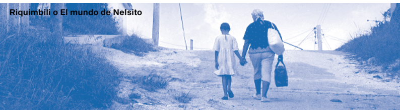
Riquimbili o El mundo de Nelsito

Mit hochaktuellen Produktionen soll nicht nur Gelegenheit gegeben werden, den neusten filmkulturellen Entwicklungen Kubas nachzuspüren, sondern es werden auch Einblicke in ein sich im Umbruch befindliches Land vermittelt. ★ So portraitiert der Episodenfilm Cuentos de un día más (2021) auf leichte und unterhaltsame Weise das Leben in Kuba während der Corona-Pandemie. Die Projektleitung für diesen Film übernahm niemand geringeres als Fernando Pérez, dem die Kubanischen Filmtage einen kleinen Schwerpunkt widmen. ★ Pérez, der international bekannteste Filmmacher Kubas ist ebenfalls mit seinem in Deutschland erfolgreichsten Film La vida es silbar (1998) vertreten; zur Eröffnung am 17. Mai zeigen wir seine neuste Produktion Riquimbili o El mundo de Nelsito (2022) als NRW-Premiere. Im Anschluss: Filmtage-Party mit Cocktails und Live-Musik.