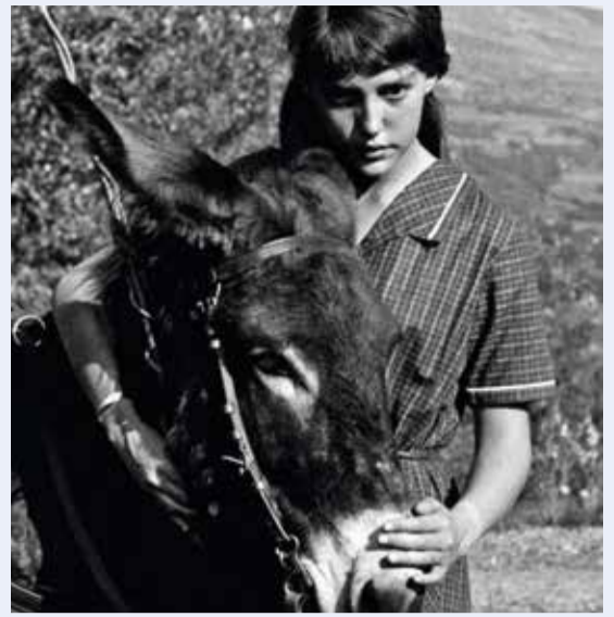
Mi. 7.6., 20:00 Uhr AU HASARD BALTHAZAR (1966)