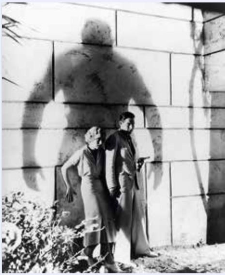
Mi. 5.4., 20:00 Uhr und So. 30.4., 15:00 Uhr ISLAND OF LOST SOULS (1932)