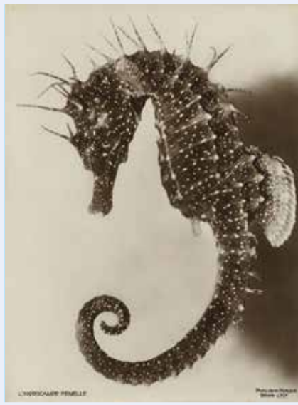
Mi. 3.5., 20:00 Uhr & So. 14.5., 17:00 Uhr L'HIPPOCAMPE (1934)