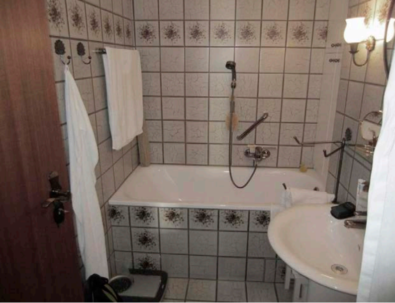
Bad vorher und Bad nachher