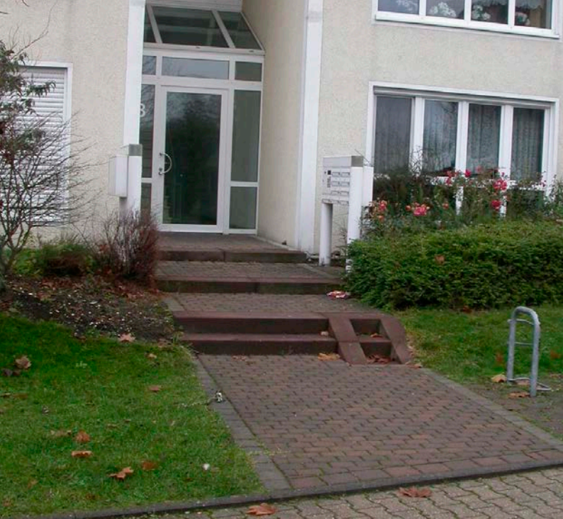
Treppe vorher und Rampe nachher