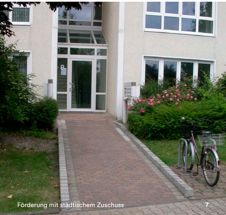
Förderung mit städtischem Zuschuss