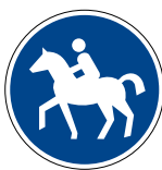
Abbildung 1: Reitweg

Mit dem Erwerb des Reitkennzeichens helfen Sie, die Reitwege in einem ordentlichen Zustand zu erhalten.