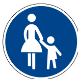
Abbildung 2: Gehweg