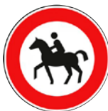
Abbildung 3: Reitverbots- schild