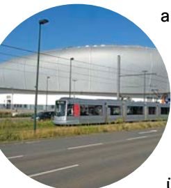
PSD BANK DOME

Mit dem Mannesmann-Röhrenwerk wurde das früher von der Landwirtschaft dominierte Rath ab 1897 durch die Schwerindustrie geprägt. Es gibt auch ansehnliche Wohnsiedlungen, die von rund 21.000 Ratherinnen und Rathern liebevoll gepflegt werden. An der Theodorstraße entstand der PSD BANK DOME und ein neuer Gewerbe- und Dienstleistungsstandort. Der Aaper Wald ist die Grüne Lunge des zu über 50 Prozent grünen Stadtteils.