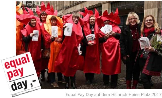
Equal Pay Day auf dem Heinrich-Heine-Platz 2017