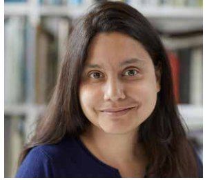
Dr. Mithu Sanyal