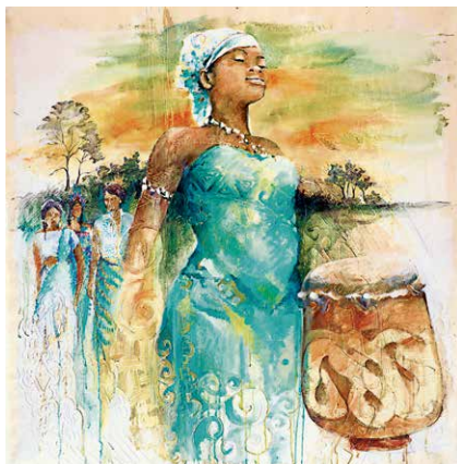
Titelbild zum Weltgebetstag 2018 mit Bildtitel „Grangangi Mama Aisa (In gratitude to mother Earth)“, Sri Irodikromo