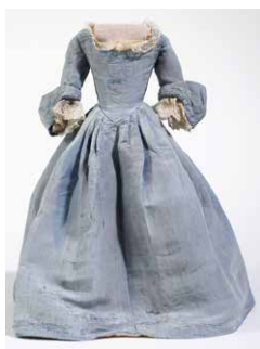
Puppenkleid um 1750